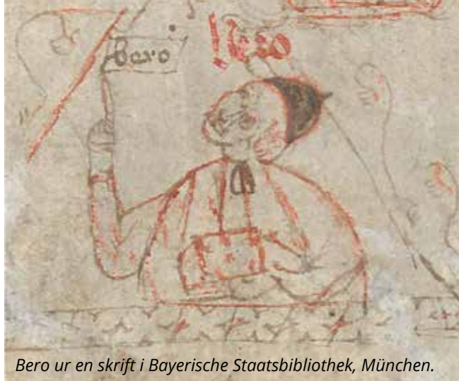
Bero ur en skrift i Bayerische Staatsbibliothek, München.